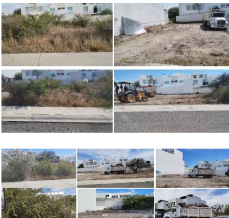
Se realizaron varios viajes dentro del fraccionamiento

NOTA: NO ES OBLIGACIÓN DE LA A.C. (Los servicios dependen de la recaudación de cuotas).